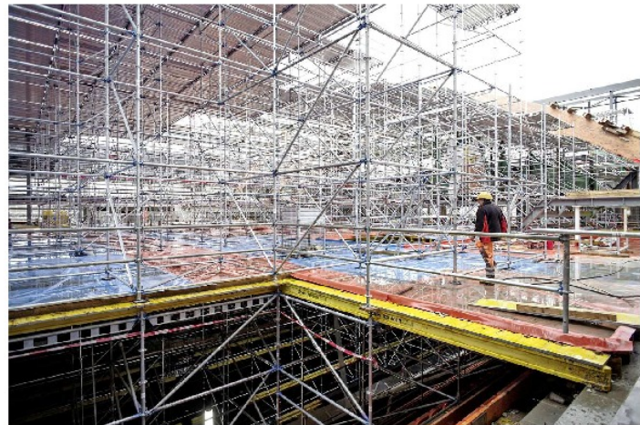
une transformation et un agrandissement spectaculaires.