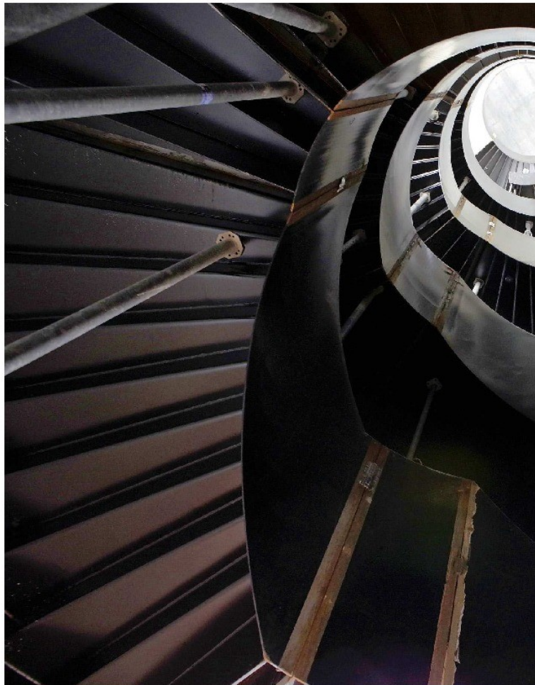
Depuis l'arrivée des premières pelles mécaniques au printemps 2018 jusqu'au démontage du toit ces jours en passant par la réalisation des escaliers hélicoïdaux aux quatre coins du site, le chantier de la patinoire Saint-Léonard a connu